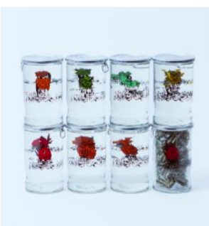
曳山カップとおつまみいりこ