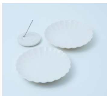
JICON菊皿とお香立て(ハマ)