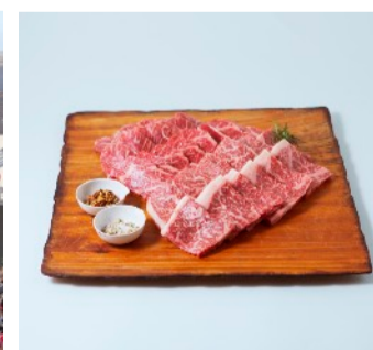
県産しろいし牛の焼肉セット

メディア関係者様向け提供画像： https://bit.ly/2lpVsTy （ご使用の際はご一報いただきますようお願いいたします。）